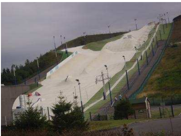
Piste artificielle de ski à Noeux-les-Mines (62)

C'est pourquoi le législateur a missionné les départements pour mettre en place des CDE-SI (cellule départementale des espaces, sites et itinéraires). Ces dernières sont chargées de recenser, d'organiser et de gérer les espaces, sites et itinéraires relatifs aux APS de plein air en concertation avec l'ensemble des acteurs concernés par ces lieux de pratiques.